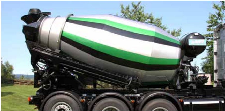
Rännan i transportläge.