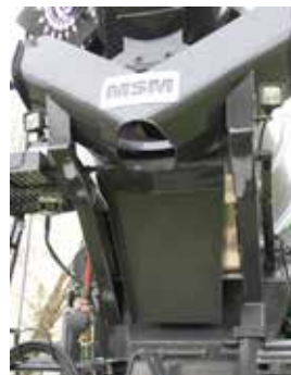
Vår egen utvecklade kortränna för körning till pump.