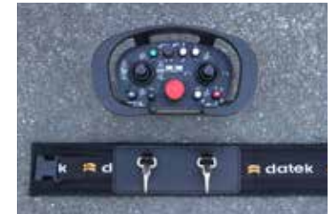
Den nya utvecklade fjärrstyrningsenheten.

Proportionalstyrda betongutläggningsränna MSM 9/P har vi utvecklat för arbeten som kanske kräver lite mer exakt precision. Med vår nyutvecklade radioenhet utför man läggningen med enkla kommandon och kommer åt på de mest svåråtkomliga utrymmena. Samtidigt underlättar man för arbetslaget som utför själva gjutningen. Rännans flexibilitet är variabel upp till 9 meter och har en svängradie på upp till 180°. MSM 9/P underlättar mycket för gjutare, anläggningsarbetare och byggare. Kan monteras på alla rotorbilar.