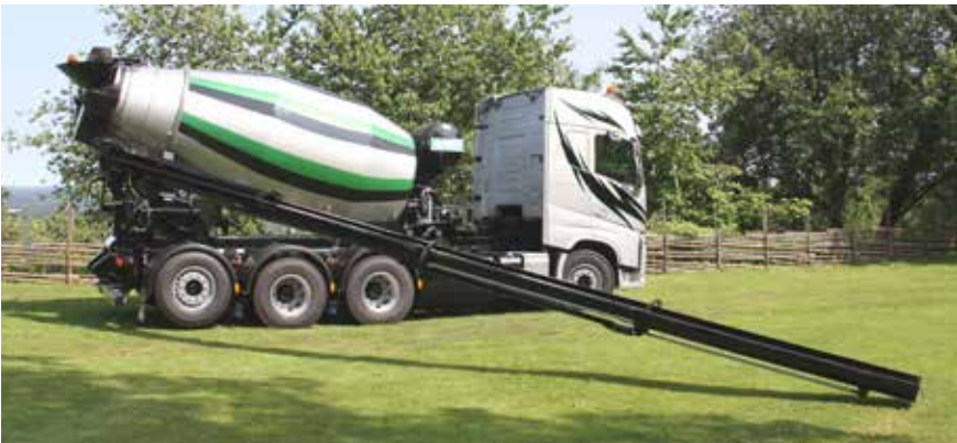
9 meters utskjut.