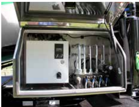
Integrerat styrsåkåp med mottagare till radiostyrning.